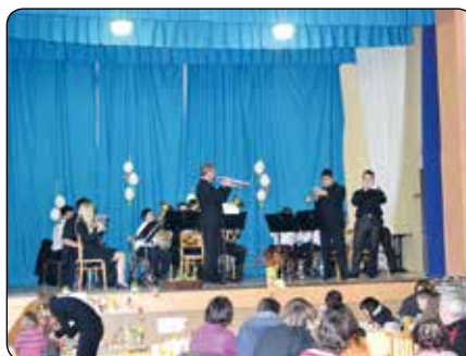
Jarní výstava s vystoupení ZUŠ Bystřice p.H.