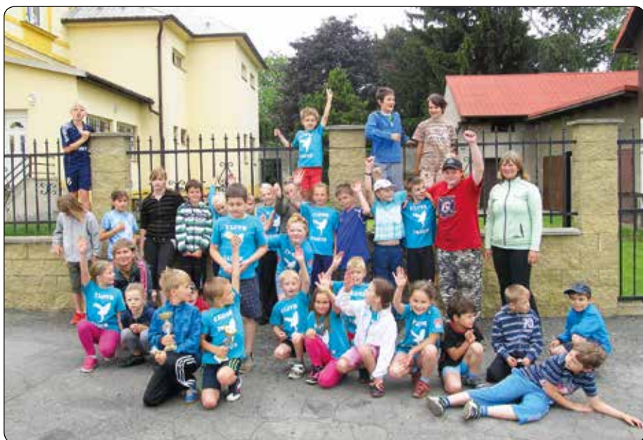
Děti v ZŠ vítězí ve volejbale