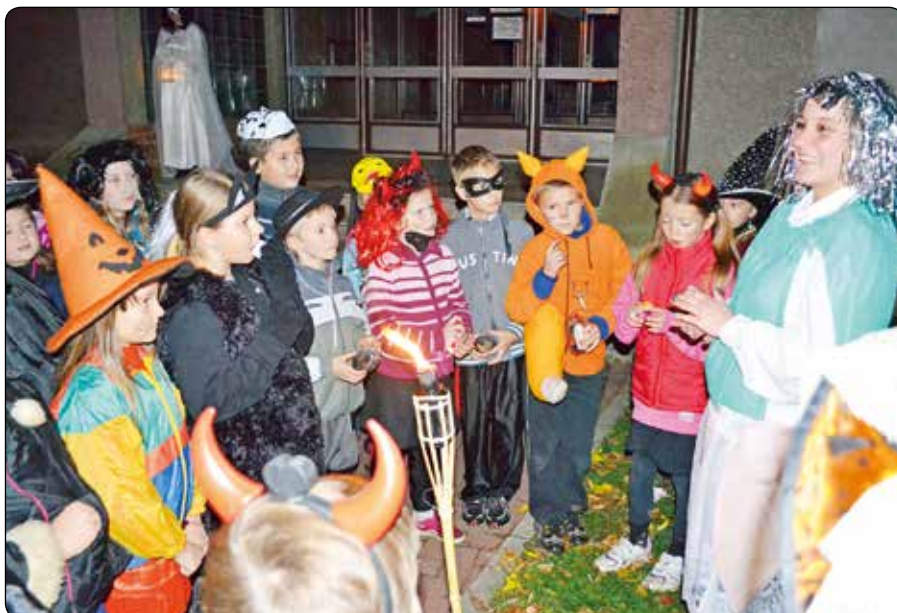
Potkali jsme strašidla