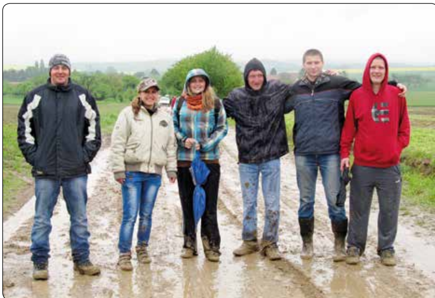
Návrat ze soutěže malotraktorů