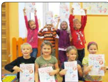
Děti z naší ZŠ