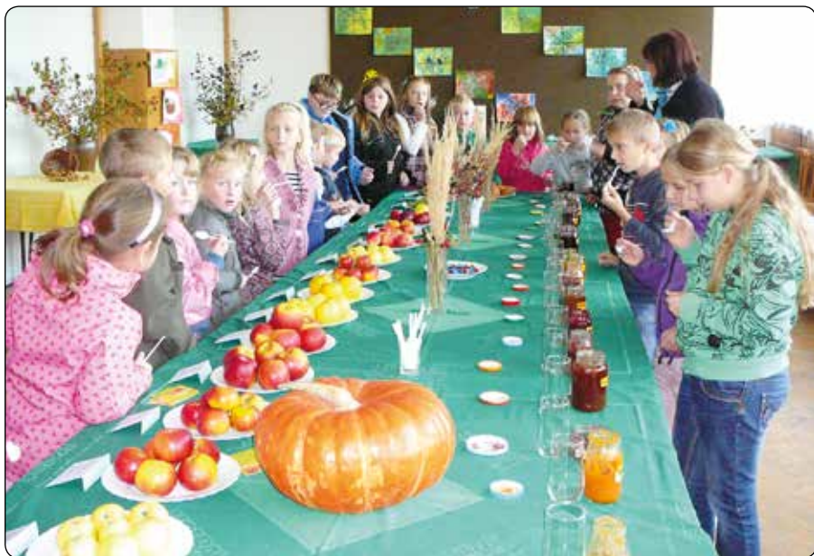
Děti hodnotí nejlepší zavařeninu