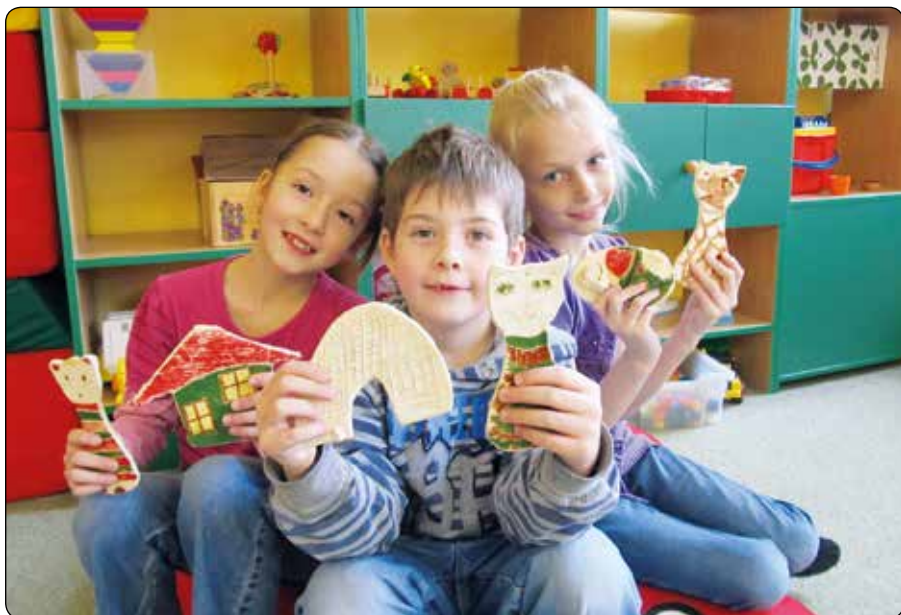
Děti ZŠ v keramickém kroužku